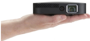
realwear HMT-1 realwear HMT-1Z1