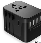
realwear HMT-1 realwear HMT-1Z1